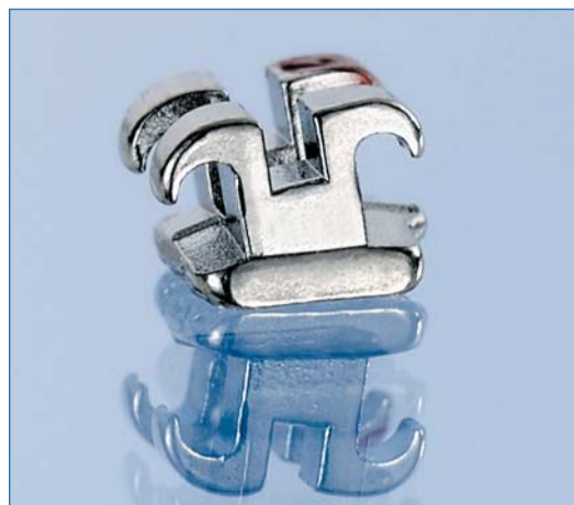
Die bewährten MiniSprint® Brackets sind ab sofort auch von 5 bis 5 im Ober- und Unterkiefer erhältlich.