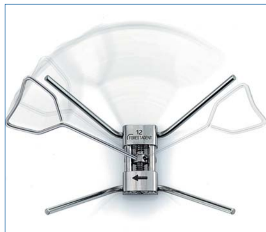
Der Snap Lock Expander, eine Gaumennahtschraube mit eingebautem Verschlussmechanismus.

Unsere dritte Neuheit sind die MiniSprint® Brackets, welche jetzt wirklich mini sind. Während diese Brackets bisher nur von 3 bis 3 im Oberkiefer in Mini-Ausführung lieferbar waren, sind die bewährten MiniSprint® Brackets nun von 5 bis 5 im Ober- und Unterkiefer erhältlich. Die MiniSprint® Brackets zeichnen sich durch eine stark reduzierte Reibung, die patentierte Hakenbasis sowie durch ein nickelfreies Material aus.